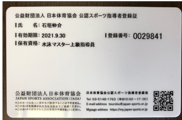
「日本体育協会」は2018年4月1日より「日本スポーツ協会」に名称が変わりました